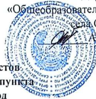
График работы специалистов консультационного пункта на 2024-2025 год